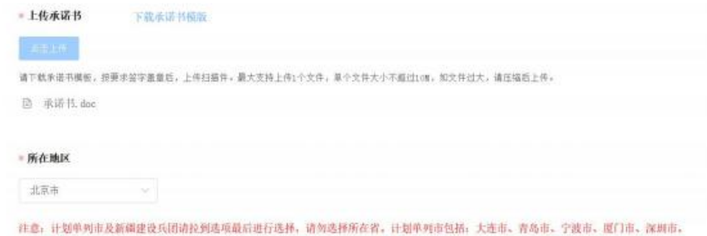
图 2-5 承诺书和所在地区

点击【下载承诺书模板】后，按照模板要求盖章、签字后，点击【点击上传】按钮，提交承诺书扫描件。“所在地区”选择时应注意：计划单列市及新疆建设兵团请拉到选项最后进行选择，请勿选择所在省。计划单列市包括：大连市、青岛市、宁波市、厦门市、深圳市。