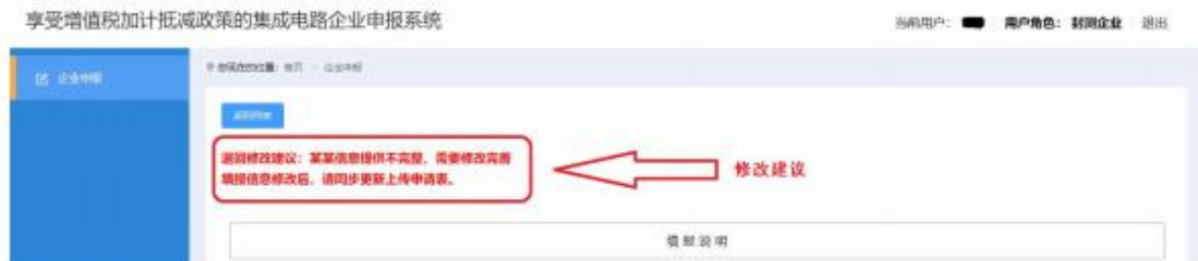
图 2-4 企业申报-退回修改