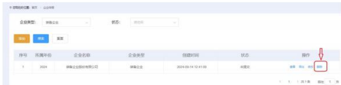
图 2-12 列表页面-删除

1.如果已经填报申报数据，需要在列表页面点击【删除】按钮将数据删除。包括删除暂存的未提交数据。否则再次点击【添加】按钮时会做出提示，政策规定：一家企业一个年度只能以一种企业类型提交申请。