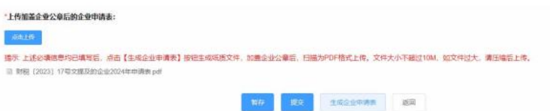
图 2-7 生成企业申请表

点击【生成企业申请表】按钮，系统会将页面填写内容按照模板格式输出文件，申报企业应按要求加盖企业公章后，扫描 PDF 格式文件，点击【点击上传】按钮上传文件。