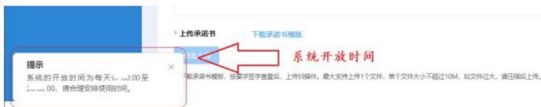
图 2-9 系统开放时间

点击“企业申报”模块名称，进入列表页面。点击【添加】按钮进入信息填报页面。请认真阅读“填报说明”关于填报时间、政策要求等相关信息。申报企业应在规定时限内提交申报材料，逾期系统将关闭通道。同时，本系统会结合实际工作安排，适时关闭夜间访问，请申报企业合理安排使用时间。