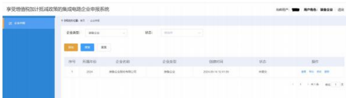
图 2-3 企业申报-列表页面

特别建议：因填报和提交的扫描文件较多，相关内容可能需要企业多个部门协同完成。因此建议正式申报之前，应点击【添加】按钮，记录申报页面需要填报和提交的扫描文件，分发给各部门筹备，指定负责人收集相关资料后统一进行申报操作。