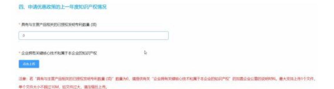
图 2-6 知识产权信息

请提供有关“企业拥有关键核心技术和属于本企业的知识产权”的加盖企业公章的说明材料。